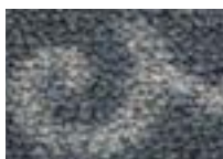
Silver 950 4 m